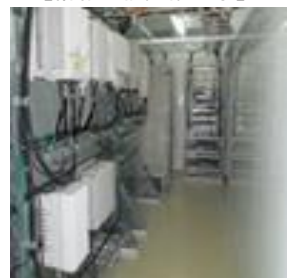
【システム設備工事】