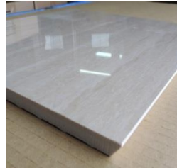
【大判トメ加工仕上げ】