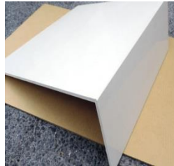
【大判鈍角曲り加工】