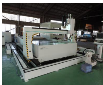
【ウォータージェットカッター】