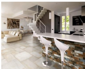
【建築用石材加工（内装）】

また、小判タイル『壁タイル』・石材をユニット化する作業も行っております。タイル加工技術は接着焼物加工（複数のタイルを平物素材から削って接着）と一端成型焼物加工（プレス）に大別されます。当社グループはより用途の広い接着焼物加工を主流としており、原価低減、加工時間圧縮が可能となるため、「安く、早く納品すること」を可能としています。また、接着焼物加工は様々な角度・形状に加工できるという特性を持ちながら、一端成型焼物加工に劣らない品質と強度を実現しております。