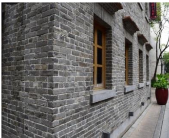
【建築用石材加工（外装）】

当事業における株式会社ケイズクラフトの位置付けは、主に『壁タイル』の加工及び販売であります。『壁タイル』には小判タイルを使用することが多く、主に外装に使われます。『壁タイル』は、従来品の45二丁タイルから4丁タイル、ボーダータイルの90度曲り、マグサ、鈍角曲りなどはもちろんのこと、石材ピースのカット溝入れ、紙貼り、ネット貼り、石面・山形タイルの曲り、トメ加工に加え、最新の技術として、コバ面の焼付塗装加工があります。今までタイルの分野では、表面に釉薬のかかったタイルの場合、コバ面と同色ではないために目線に入る場所での施釉タイルの壁施工は敬遠されがちでしたが、コバ焼付塗装技術により様々なデザインタイルの壁使用の可能性が広がってきております。