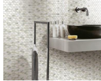
【小判タイルイメージ図】